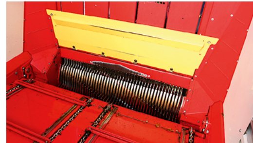
Der Kratzboden ist um 15 cm abgesenkt, es gibt zwei Plattformhöhen und eine Kanalabdeckung.

Anders als die drei „kleineren“ Torros haben die beiden neuen Wagen ein Chassis aus dem gleichen C-Profil wie