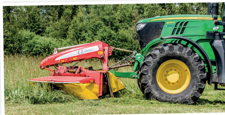
Čelně nesené žací stroje NovaCat F ED v závěsu Alpha motion vlastní firma AGRO SVOBODA tři. Na loukách se vyznačují vynikajícím kopírováním terénu, při němž si stále udržují nastavenou hodnotu přítlaku

sklízet pomocí kombinace lisu s baličkou, anebo budou procesy lisování a ovíjení vzájemně časově oddělené? Výrobci nabízejí stroje pro obě technologie. Záleží na struktuře podniku a na celé řadě dalších faktorů, které