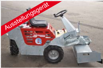
Westermann Cleanmeleon II mit E-Start, mit ASS 900 Spaltenschieber und Gewichte statt € 4.640,- € 3.900,-