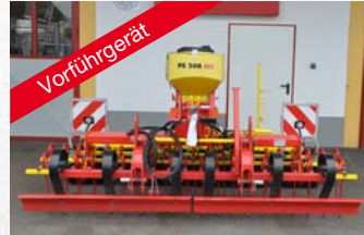
APV Grünlandstriegel GK 300 M1 mit Zahnwalze 410 mm inkl. PS 200 M1 Streuer statt € 18.715,- € 14.000,-