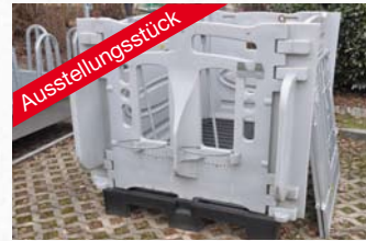
Patura Kälberbox Vorder- und Rückwand, 2 x Seitenwand und Gitterboden statt € 923,50 € 769,-