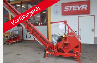
Vogesensolomat Wippsäge mit hydr. Wippe und 5 m Förderband statt € 8.880,- € 5.600,-

Weitere Lagermaschinen jetzt zum Sonderpreis.