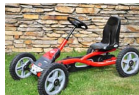
BERG Gokart Case IH