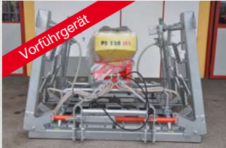
Wölfleder Wiesenegge 5,1 m hydraulisch klappbar APV Streuer PS 120 M1 mit elektr. Gebläse und Steuermodul 3,2 statt € 9.292,80 € 6.300,-