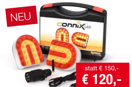
Kabelloser LED Beleuchtungssatz Wiederaufladbar, magnetisch - zum einfachen Wechseln statt € 150,- € 120,- Sie sparen € 30,-