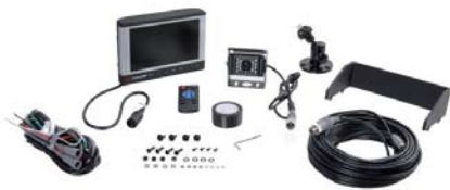
Kamerasystem 7" TFT