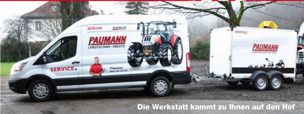
Die Werkstatt kommt zu Ihnen auf den Hof