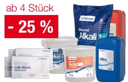
ab 4 Stück - 25 % DeLaval Reinigungsmittel zB Pulver Alkalisches konz. 25 kg Sack statt € 107,76 € 80,82 / Stk.