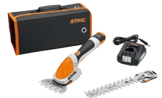
STIHL Akku Gras-/Strauchschere