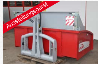
Rosensteiner Dreipunktlaster Samurai 200D m. Bordwandschwenkvorrichtung statt € 3.706,- € 2.850,-