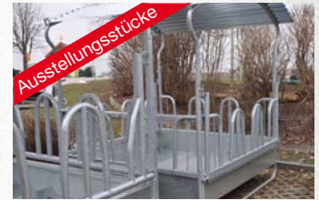
Patura Viereckraufen mit Palisadenfressgittern € ab 999,-