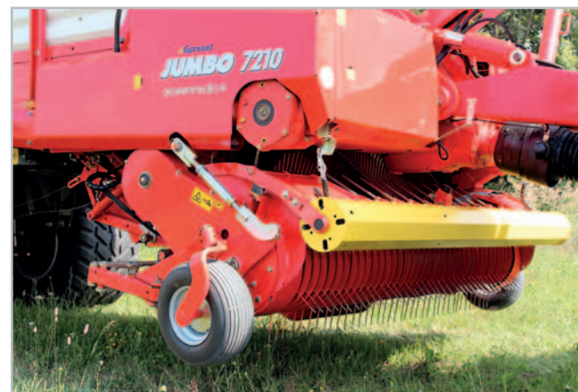
Díky svým sběračům s velkou pracovní šířkou zvládají oba nové návěsy Jumbo 7200 D i vydatné řádky od sklízecích mlátiček Claas Lexion se žacími adaptérem o záběru devíti metrů, a to i po ozimém žitě, které se sklízí dříve, kdy je sláma ještě zelená a má zvýšenou vlhkost

Dva tyto návěsy každoročně sklídí a do místa uložení odvezou zavadlou píci z výměry 800 až 1200 hektarů. Mezi tím sbírají ještě seno ze dvou set hektarů a pro krmné účely také pšeničnou slámu z celých tří set hekta-