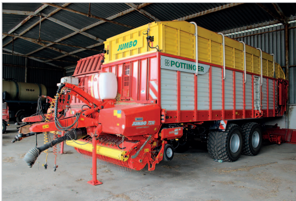
Také středisko v obci Dohnalova Lhota posílil jeden nový návěs Jumbo 7210 D. Vůz má pěknou výbavu včetně zařízení na přidávání aditiva, automatického brousidího zařízení Autocut či přídatného osvětlení zadní části i ložné plochy