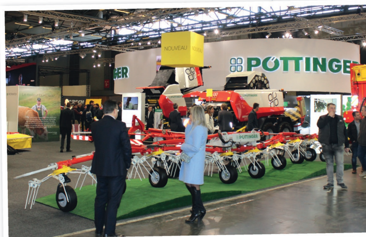
Firma Pöttinger připravila na veletrhu SIMA 2019 rozsáhlou výstavu své techniky, na kterou se přišly podívat davy zájemců. Kromě toho oslavila dceřiná společnost Pöttinger France 20 let trvání a dalším důvodem k oslavě bylo ocenění Stroj roku 2019 pro žací kombinaci NovaCat A10 Cross Flow

Pro podniky, které využívají shazování hmoty na jeden řádek pouze při sklizni ozimého žita na GPS a u dalších plodin nikoli, nabízí žací kombinace NovaCat A10 CrossFlow i možnost kombinovaného ukládání. Jednoduchým manuálním otevřením krycího plechu u jednoho ze dvou