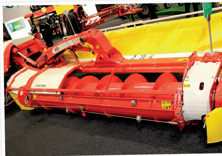
Průměr dopravníku Cross Flow a volný prostor pod kryty jsou zvoleny tak, aby nebyl problém dopravovat i velké množství píce. Jednoduchým manuálním otevřením (červeného) krycího plechu u jednoho ze dvou šneků se docílí kombinovaného ukládání hmoty