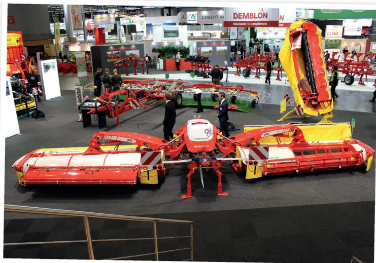
Revoluci ve shazování posečené píce na řádek přináší nová žací kombinace NovaCat A10 Cross Flow. S kompaktními rozměry, sníženou hmotností i menší energetickou náročností nabízí možnost šetrného ukládání hmoty na jeden řádek bez odrolu a bez znečišťování

Pro podniky, které využívají shazování hmoty na jeden řádek pouze při sklizni ozimého žita na GPS a u dalších plodin nikoli, nabízí žací kombinace NovaCat A10 CrossFlow i možnost kombinovaného ukládání. Jednoduchým manuálním otevřením krycího plechu u jednoho ze dvou