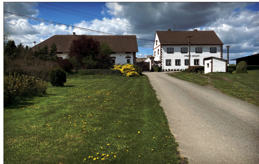
Rodinná Farma Hejlov, nacházející se nedaleko od Tábora, se zabývá nejen hospodařením, ale nabízí i ubytování v nově zrekonstruovaných prostorách

řeny těžkou půdou. Zvýšený tahový odpor a nezbytnost výkonného traktoru jsou samozřejmostí. I tak se ale houževnatí hospodáři vytrvale věnují podrývání svých pozemků do větších hloubek, hlavně před setím ozimé řepky, a také orbě. Orba do hloubky 25 cm se provádí na podzim v každém případě na polích, kde bude následovat setí jařin, ale někdy též pod ozimou. K orbě slouží polonesený pluh Servo 6.50 Nova od firmy Pöttinger. Se šesti páry orebních těles je tak akorát za traktor John Deere 7230 R. Pluh byl pořízen v roce 2013 jako první stroj značky Pöttinger na farmě. „Jsme s ním maximálně spokojeni, umí nám zajistit čistý stůl, a z důvodu polní hygieny má své místo vždy při setí ozimé pšenice po shodné předplodině, při