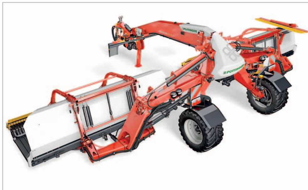
Nový shrnovač může vytvářet středový nebo boční řádek (řádky) velice kvalitního objemného krmiva

Šestiřadý řízený sběrač zajišťuje maximální výkon s minimálním znečištěním píce. Sklizená plodina se šetrně zvedá z povrchu pozemku pomocí vlečených prstů a dopravuje se na příčný dopravníkový pás. Díky ovládní vačkovou dráhou se prsty spouštějí pouze těsně před pásem. Překládací bod je umístěn o 120 mm výše než příčný dopravník, takže píce dopadá na pás sama. Plná funkčnost je zajištěna jak při jízdě z kopce, tak při krátké píci. Válcový podvozek je umístěn velmi blízko místa, kde pracují sběrací hroty a za-