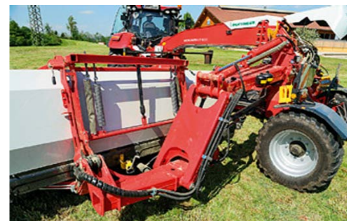
Každá pásová jednotka je odľahčovaná. Pöttinger čerpal pri konštrukcii rámu z know-how žacích lišt.