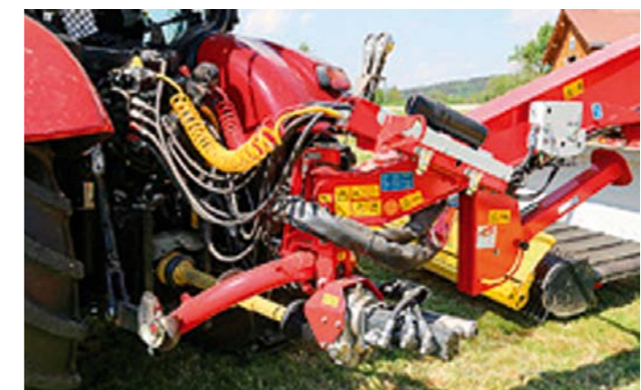
Mergento sa pripája na spodné ramená traktora Kat. IIIN, hriadeľ poháňa tri olejové čerpadlá.