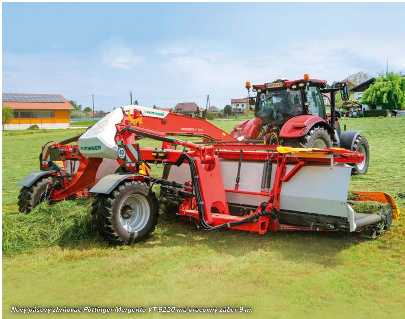
Nový pásový zhrňovač Pöttinger Mergento VT 9220 má pracovný záber 9 m.