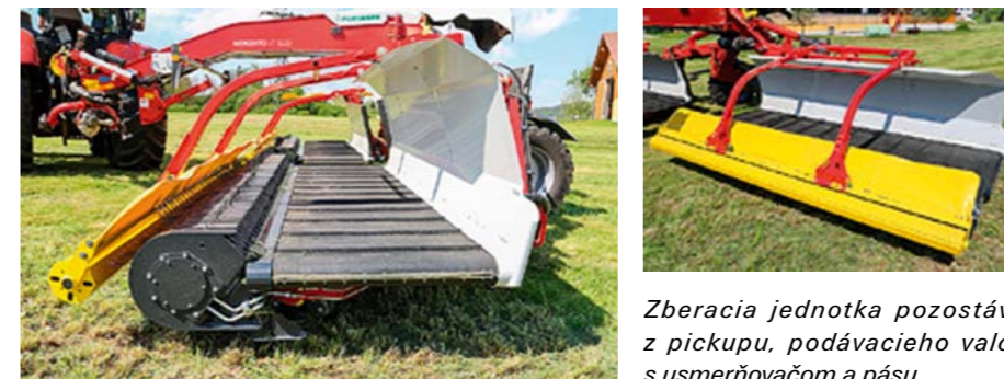
Zberacia jednotka pozostáva z pickupu, podávacieho valca s usmerňovačom a pásu.

Na kyvný čap sa pripája vzpera, ktorá nesie samotnú pásovú jednotku. Aj tu sa nachádza hydraulický valec, ktorý zabezpečuje posun pásu. Vahadlo umožňuje výkyv o 30° hore a 13° dole. Pöttinger tu používa ďalšie hydraulické valce. Jeden stabilizuje rameno pri zdvíhaní, druhý zabezpečí, aby sa pickup pri zdvíhaní ramena pridvihol o ďalších 11,5°. Výška sa reguluje pomocou dvoch kopírovacích valcov s priemerom 22 cm. Výška zberu 0 až 11 cm sa nastavuje pomocou kľuky.