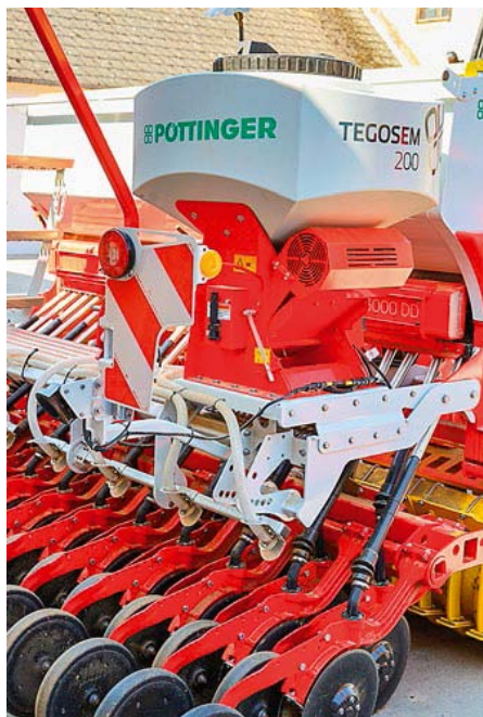
Sejačka na prísev Tegosem dokáže zasieť ďalší komponent.

ako voliteľná výbava je k dispozícii hydraulické nastavenie prítlaku radličiek.