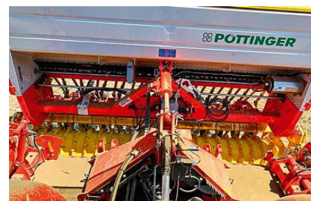
Vodič z traktora má na stroj výborný výhľad.

Ďalšia citelná zmena sa však týka bočných krytov. Teraz sú k vani bližšie, pričom je dodržaná prepravná šírka 3 m bez