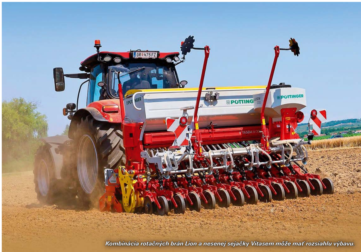
Kombinácia rotačných brán Lion a nesenej sejačky Vitasem môže mať rozsiahlu výbavu.