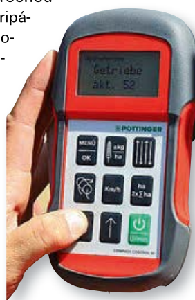
Počas kalibrácie sa zobrazuje nastavenie a otáčky.