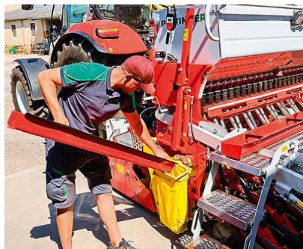
Nastavenie výsevu prebieha na ľavej strane a procesy sú dobre premyslené.