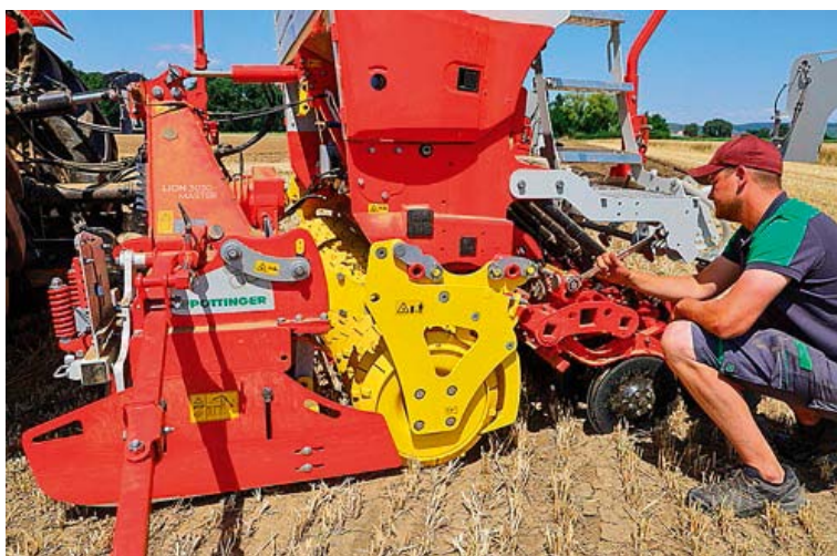
Račňový kľúč je dobrým pomocníkom pre takmer všetky mechanické úpravy.