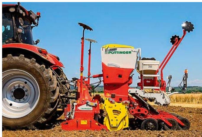
Príplatkový hydraulický horný bod zdvíha pätky a posúva ťažisko dopredu. Otočný bod je nad valcom.

hydraulické nastavenie hĺbky. Hydraulický piest vytyčuje polohu valca. K dispozícii je sedem rôznych typov urovňavacích valcov s priemermi 42; 54 a 60 cm.