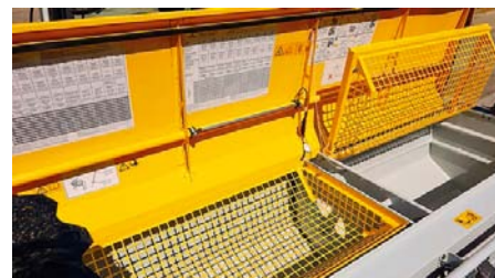
Praktická mriežka v zásobníku unesie aj vrecia.