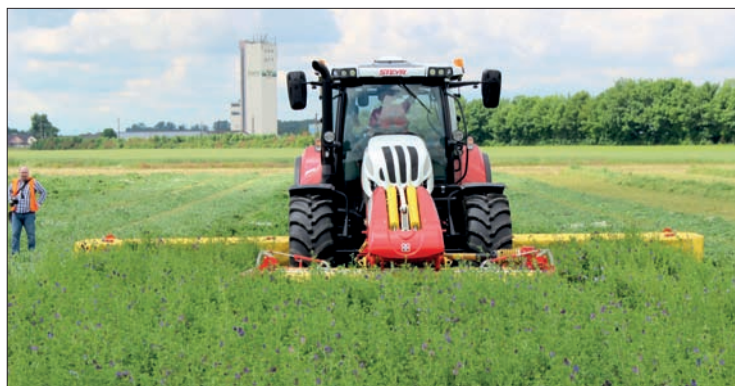
Traktory Profi CVT mohou být v výrobě vybaveny satelitním navigačním systémem. V průběhu workshopu předvedl traktor Profi 4145 CVT sečení podle navigace s kombinací o záběru 8,1 m

závěsu tak, aby zapojování hadic bylo snadné. Obsluhu traktoru usnadňuje také jednoduchý management ovládní vývodového hřídele na základě pohybu tříbodového závěsu. Řidič si může nastavit polohu závěsu, ve které dojde automaticky k vypnutí hřídele a poté i k jeho zapnutí. Management funguje pro zadní i čelní vývodový hřídel. Rozběh hřídele je modulovaný. V rámci moderních trendů jsou přední tříbodový závěs i vývodový hřídel vhodně integrovány do předních partií traktoru.