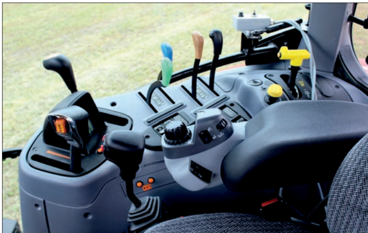
Traktory Profi Classic nemají loketní opěrku, ale ovladače (s výjimkou TBZ) jsou rozloženy na pravé postranní konzole tak, že jsou dobře dosažitelné. V pravém rohu nahoře je malý panel pro sklápění shrnovače do transportní polohy, které se tak obejde bez otevírání okna a manipulace s provázkem

nastavovat z kabiny pracovní záběr plynule v rozsahu od 7,7 až do 8,4 m. Obrabeč má podvozek s řízenou nápravou a při otáčení plynule sleduje traktor. Připojený byl do spodních táhel tříbodového závěsu a díky tomu se docílovalo i výborné manévrovatelnosti. Ta je nakonec výsadou i všech modelů traktorů Steyr nové řady Profi. Jsou postaveny na podvozku s větším rozvorem (na úrovni šestiválcového modelu), což má příznivý vliv na stabilitu za jízdy větší rychlostí i na tahový výkon. Nicméně manévrovatelnost zůstala na dobré úrovni díky možnosti natočení předních kol ve velkém úhlu rejdu. Po skončení práce na poli se obrabeč položí na půdu, rotory se vysunou do krajové polohy, sklopí se se svými nosníky nahoru a poté se hydraulicky zasunou dolů k rámu. Tím má shrnovač transportní výšku pod čtyři metry, zároveň se automaticky aktivuje mechanické transportní zajištění. Modely Steyr Profi nabízejí více komfortu. Od traktorů Profi Classic se odlišují na první pohled nejenom chybějícím nápi-