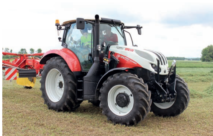
Traktory Steyr Profi v provedení Classic jsou vybaveny sníženou kabinou, která s velkou plochou prosklení umožňuje kvalitní výhled. S odpruženou kabinou a přední nápravou poskytují obsluze kvalitní pohodlí

Za jízdy traktoru bylo patrné, jak čistou práci odvádí nový typ shrnovače s dvojicí velkých rotorů TOP 842C firmy Pöttinger. I vydatné řádky píce od žacíh strojů shrnul do jednoho středového, vzdušného a rovnoměrně formovaného řádku. Teleskopická konstrukce nosníků obou rotorů dovoluje