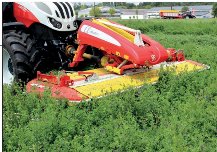
V závěsu alpha-motion je čelní žací stroj NovaCat 301 F agregován podobně jako stroje tažené, a pokud by se stalo, že by narazil na překážku, vychýlí se ihned nahoru a nepoškodí se. Zajímavostí jsou hydraulicky ovládané boční kryty

Zajímavá inovace se dotkla podvozku. Ten má zvětšený rozvor díky tomu, že všechny modely nové řady Profi jsou postaveny na podvozku šestiválcových typů. Tím je zajištěna vyšší stabilita při přepravě a zároveň i vyšší tahový výkon v poli. Přední náprava prošla vylepšením a je nabízena ve dvou provedeních: jako Class 3 a Class 4. Druhá verze pak umožňuje zvýšení celkové dovolené hmotnosti traktoru až na 9000 kg, čímž se zvýší i užitečné zatížení. Pro traktor pak není problém agregace například