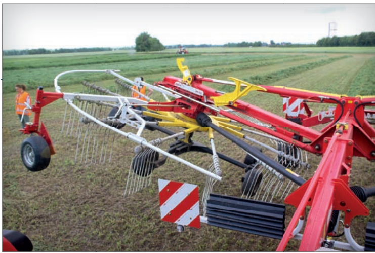
Shrnovač Pöttinger TOP 842C má plynule nastavitelný pracovní záběr rotorů, aktuální hodnotu zobrazuje dobře čitelná stupnice. Možnost zasunutí rotorů také dovoluje transportní výšku pod čtyři metry