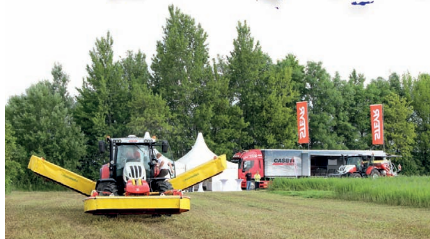
V průběhu workshopu v Rakousku byla prezentována nová řada traktorů Steyr Profi a rozličné možnosti jejího provedení, výbavy a využití

V prostorné kabině najde dostatek prostoru řidič i spolujezdec. Pravou rukou ovládá jak otáčky motoru, tak i řazení, pomocí páky ručního plynu s integrovaným ovladačem pro řazení rychlostí. Případně lze řazení rychlostí při zatížení v převodovce Powershift přene-