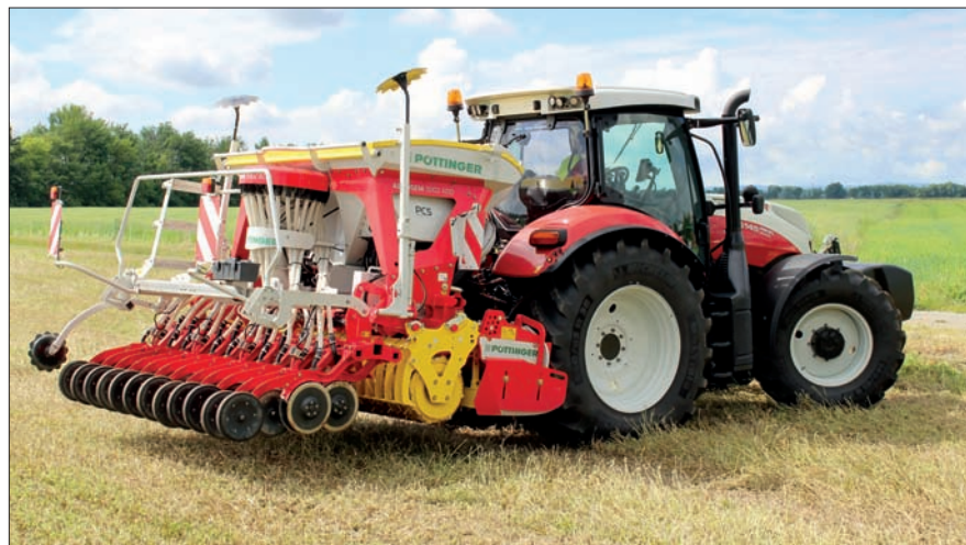
Traktory řady Profi jsou osazeny robustní zadní nápravou, která dovoluje zatížení 7,3 t. Úměrně tomu disponují i zvedací silou zadního tříbodového závěsu na úrovni 65 kN, která se vhodně využije například při agregacích s nesenými secími kombinacemi