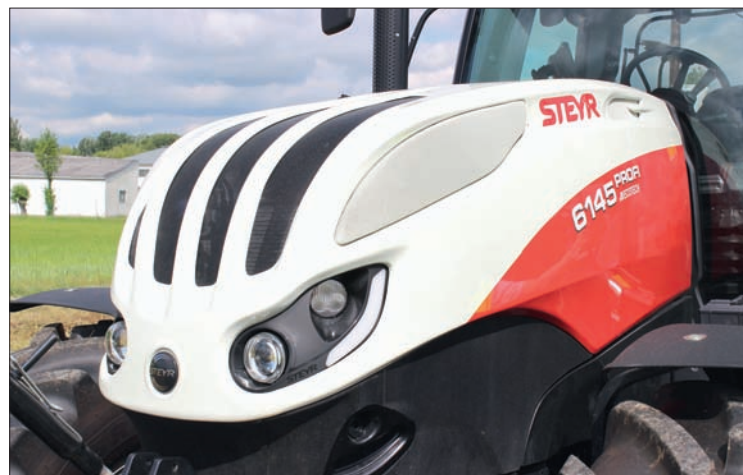
Nápadnou změnou u traktorů nové řady Profi je jejich nový design kapoty motoru, který vychází z vydařeného provedení na největších traktorech Terrus CVT