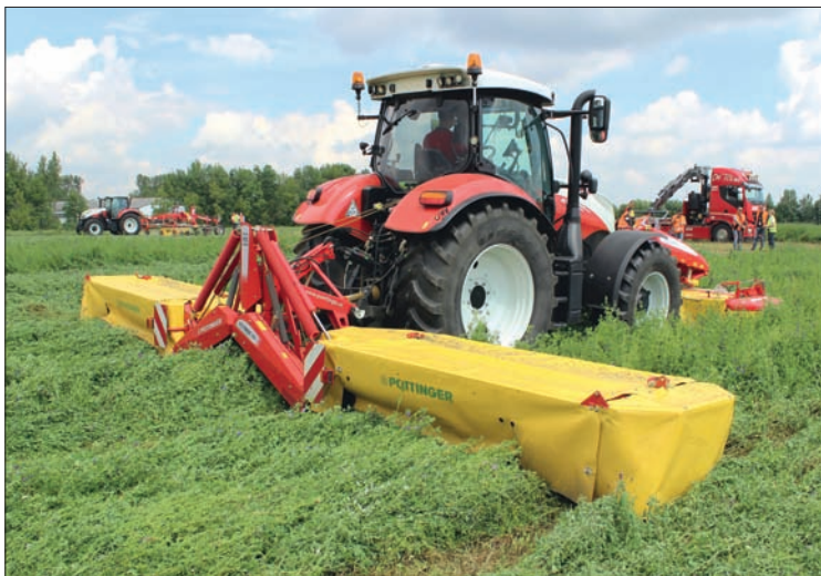
Žací kombinace Novadisc 810 nahrazuje dříve vyráběné provedení Novadisc 900. Jedná se o lehčí alternativu k velkým kombinacím NovaCat S se středovým zavěšením, ovšem s tradičně kvalitním řezem a šetrnou manipulací s pící

Přístup k motoru se získá po odklopení kapoty. Ve spodní části je motor nově doplněn o vnější odnímatelné kryty, které slouží jako ochrana před znečišťováním od podvozku.