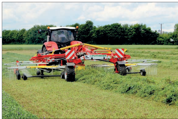
Shrnovač Pöttinger TOP 842C odváděl vynikající čistou práci. Řádek od středového shrnovače je ideální pro sběr senážními vozy, jak následně předvedl návěs Torro Combiline

nastavovat z kabiny pracovní záběr plynule v rozsahu od 7,7 až do 8,4 m. Obrabeč má podvozek s řízenou nápravou a při otáčení plynule sleduje traktor. Připojený byl do spodních táhel tříbodového závěsu a díky tomu se docílovalo i výborné manévrovatelnosti. Ta je nakonec výsadou i všech modelů traktorů Steyr nové řady Profi. Jsou postaveny na podvozku s větším rozvorem (na úrovni šestiválcového modelu), což má příznivý vliv na stabilitu za jízdy větší rychlostí i na tahový výkon. Nicméně manévrovatelnost zůstala na dobré úrovni díky možnosti natočení předních kol ve velkém úhlu rejdu. Po skončení práce na poli se obrabeč položí na půdu, rotory se vysunou do krajové polohy, sklopí se se svými nosníky nahoru a poté se hydraulicky zasunou dolů k rámu. Tím má shrnovač transportní výšku pod čtyři metry, zároveň se automaticky aktivuje mechanické transportní zajištění. Modely Steyr Profi nabízejí více komfortu. Od traktorů Profi Classic se odlišují na první pohled nejenom chybějícím nápi-