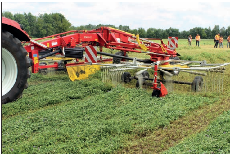
Dvourotorový shrnovač TOP 842C přesvědčil při jízdách nejen svou kvalitou práce s čistým shrnováním píče do středového řádku, ale také jednoduchým ovládním bez jakéhokoli otevírání zadního okna traktoru. Kopírování terénu bylo tradičně perfektní

Motor obsahuje zajímavou inovaci – dálkově ovládanou klapku ve výfukovém potrubí. Tato klapka umožňuje u studeného motoru po nastartování rychle zvýšit teplotu výfukových plynů, a tím i rychlý nástup účinnosti katalyzátoru SCR. Dále je významným komponentem systému motorové brzdy, který je na přání dostupný pro všechny modely řady Profi. Jakmile řidič sešlápně malý přidavný pedál pro levou nohu, uzavře tato klapka průchod pro plyny ve výfukovém potrubí, výfukové ventily ve válcích zůstanou otevřené a písty stlačují nasávaný vzduch – motor funguje jako kompresor.