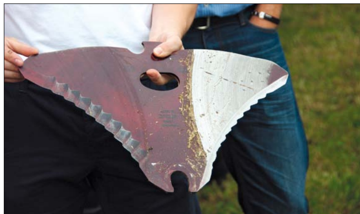
Nože s oboustranným naostřením zvyšují produktivitu práce. Stačí je v poledne otočit a může se pokračovat ve sklizni

Poprvé se s návěsem nové řady Europrofi Combiline seznámili v expozici