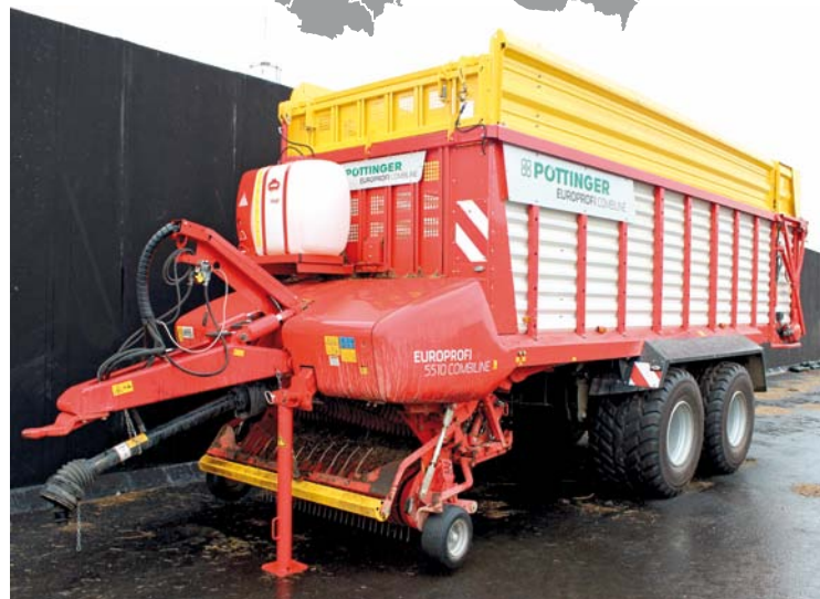
Návěs Pöttinger Europrofi 5510 L Combiline vyhovuje farmářům nejen svým objemem, ale také díky své koncepci otevřeného stropu. Za čtyři měsíce roku 2014 zvládl odvoztit 1500 tun hmoty

firmy Pöttinger na veletrhu Agritechnica 2013. Na veletrhu jej díky přítomnosti i dalších značek porovnávali s konkurencí. Rozhodování o vhodném typu vozu trvalo dlouhou dobu také proto, že farmáři měli i jiné nabídky.